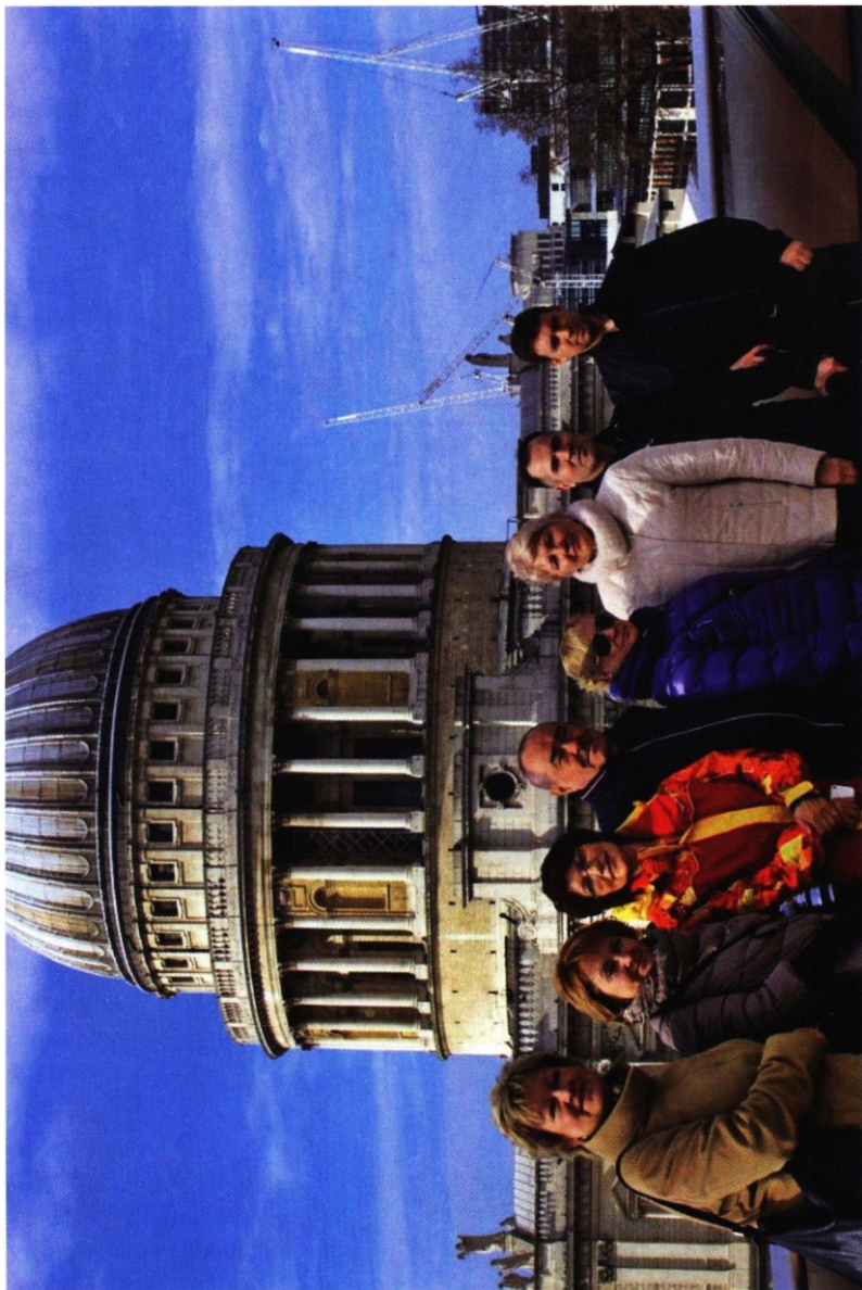
На снимке: Участники семинара в Лондоне