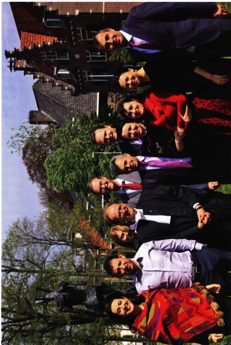
На снимке: Участники семинара в Гааге